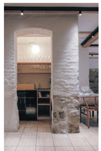
Restauranten er lavet i to etager, så det er også muligt at spise i kælderen, hvor historien også skinner igennem.

taljer i bygningerne eller finde dem frem igen. Bygningen var noget nedslidt efter at have fungeret som kommunal vuggestue i en årrække. Så vores mål var at få bragt bygningen op til sin gamle stand og genfinde ånden, siger partneren.