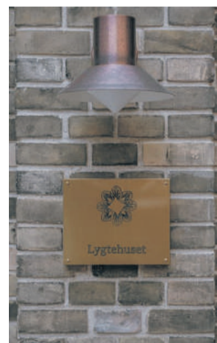
Lygtehuset, Mindegade.

- Det har været vigtigt for os at bevare alle de gamle de-