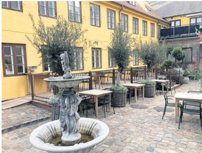
Ifølge Restaurant ET har det været planen at gøre baggården til en oase i midtbyen.

Løsningen blev et annek, som i dag kan ses for enden af den smukke gårdhave. I et miljø med brosten, små borde og træer dukker det frem