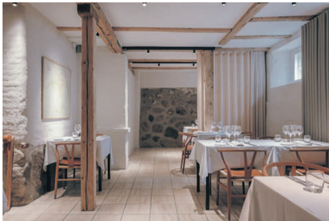
I bygningens underetage er bjælkerne en stor del af konstruktionen.

som kronen på værket i den store renovering, bygningen har gennemgået.