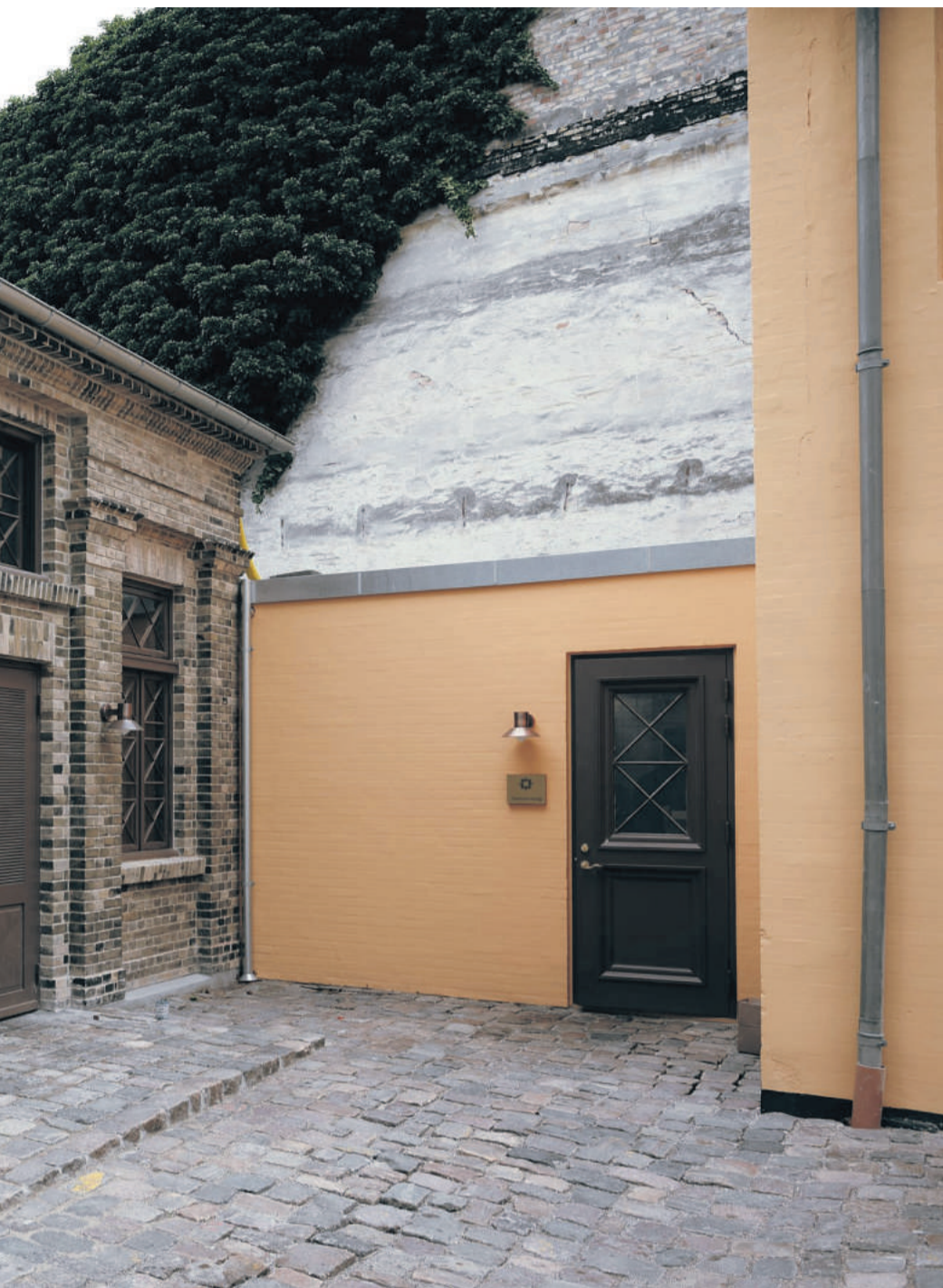
Lygtehuset i Mindegade 8 er først blevet pillet ned og memoreret sten for sten og efterfølgende bygget op igen på en ny placering i baggården. I dag fungerer det som anneks for Restaurant ET.