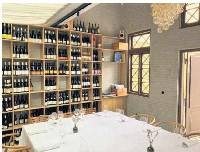
Sådan ser Lygtehuset ud i dag. Senest har der været afholdt 'Bourgogne og vinyler' i den unikke bygning.